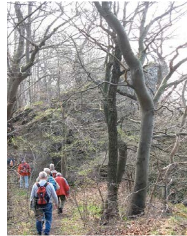
Auf dem Kammweg