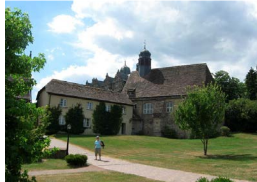
Am Schloss Hämelschenburg

Empfohlene Karte: Naturpark Weserbergland – Topographische Karte 1 : 50000 mit Wanderwegen