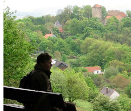
Blick auf die Schaumburg