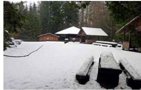
Rastplatz Wolfsbuche im Winter